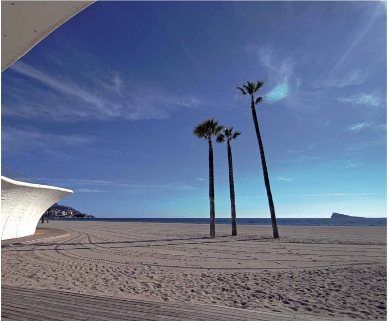
Playa de Poniente