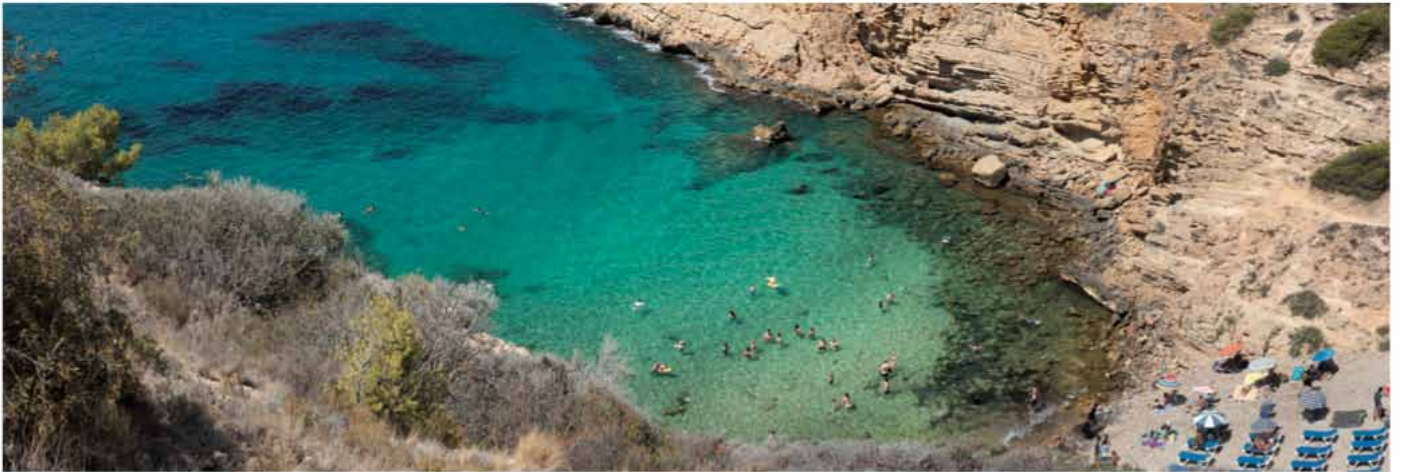
Cala Tío Ximo