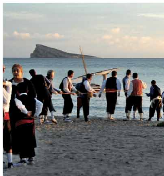
Representación del Hallazgo de la Virgen.