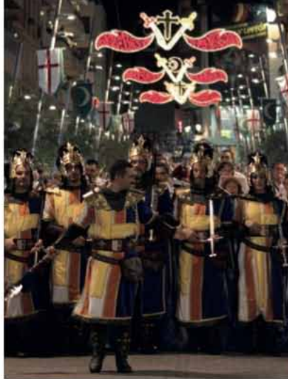
Moros y cristianos