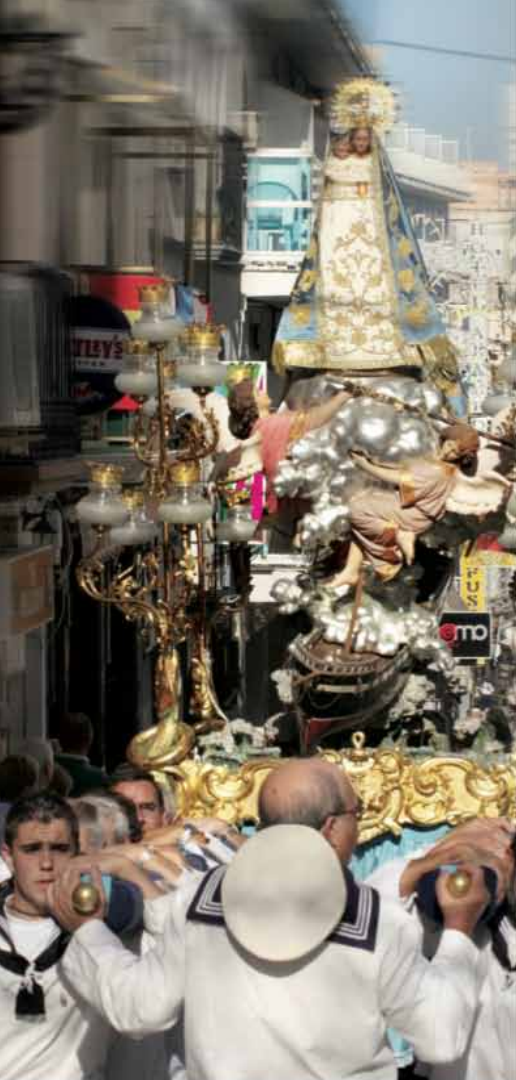
Procesión con La Patrona de Benidorm

a San Isidro Labrador y que lleva a los romeros hasta la Ermita de Sanç.