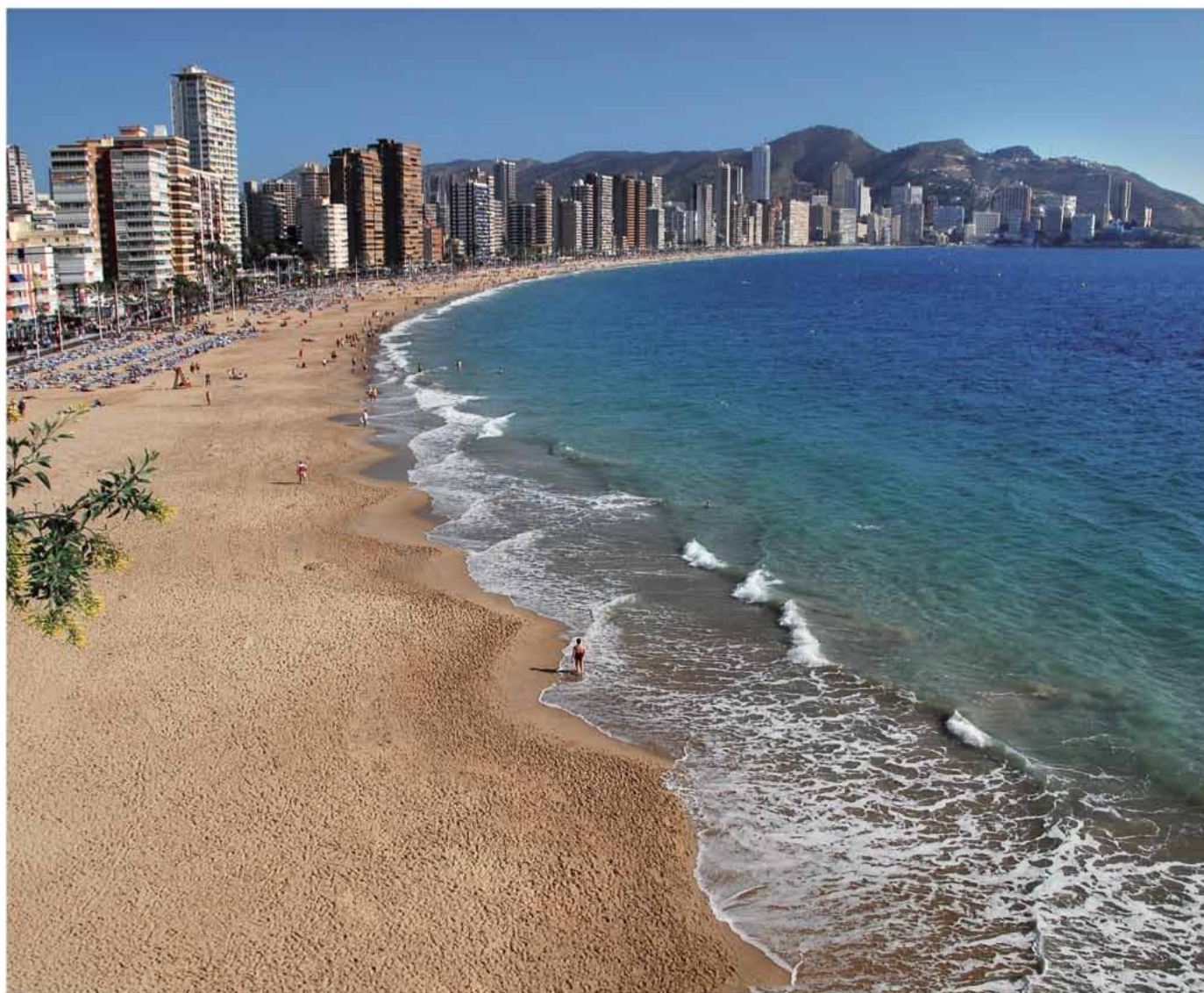
Playa de Levante