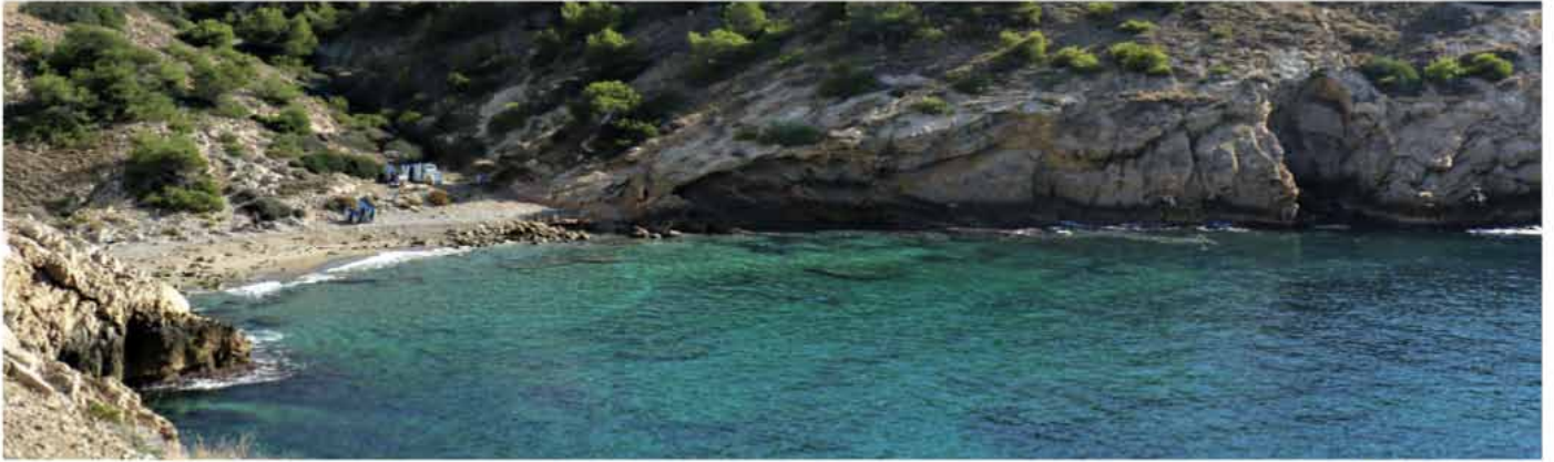
Cala de la Almadraba