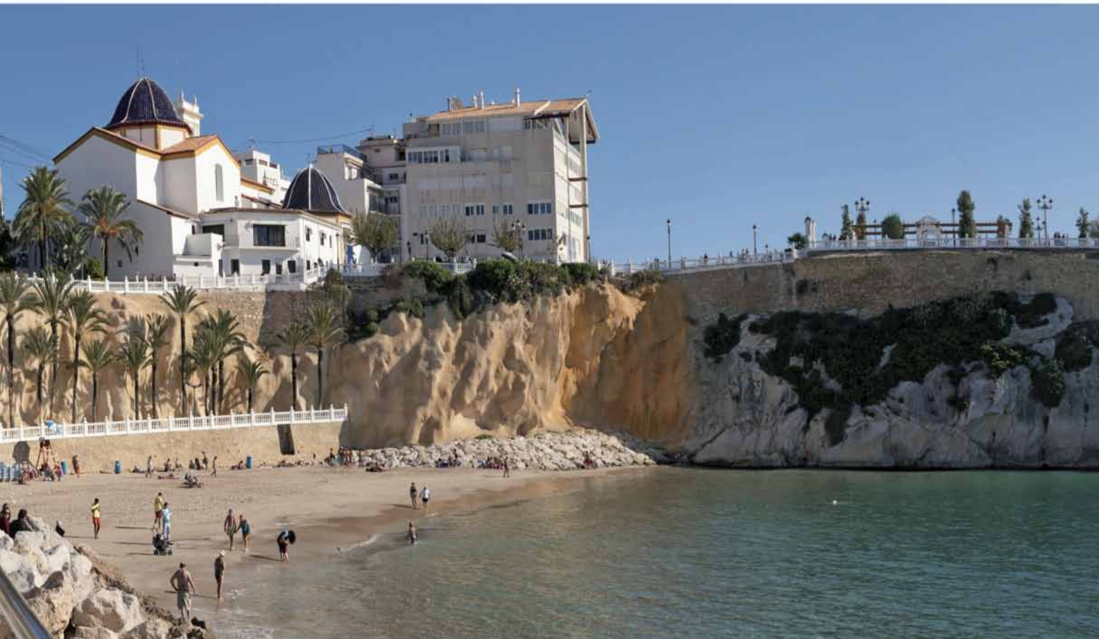
Cala del Mal Pas

Benidorm tiene las mejores playas urbanas del Mediterráneo: Levante y Poniente. Ambas comparten aguas cristalinas, fina arena, certificados de calidad, banderas azules y muchos servicios, que hacen más confortable el disfrute a pie de mar. Protegidas por la bahía de temporales, su orientación sur hace que ambas tengan muchas horas de sol, desde el amanecer hasta bien entrada la tarde en Levante y hasta el atardecer