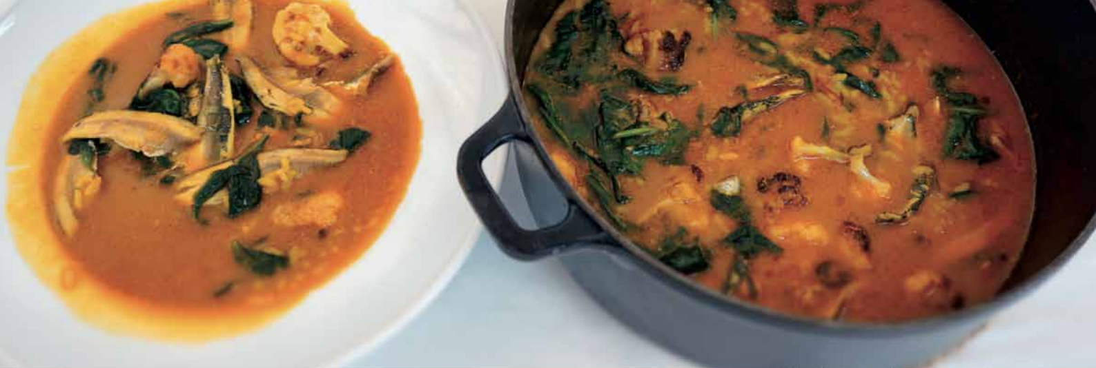
Caldero de arroz con boquerones y espinacas