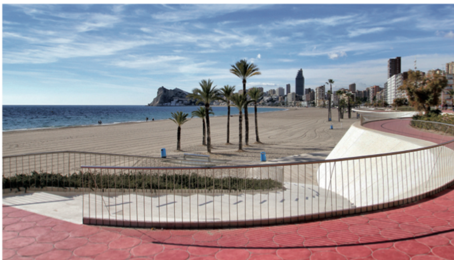
Paseo de Poniente, Premio Arquitectura Española 2011

Y en el otro extremo, el Tossal de La Cala, con unas vistas increíbles y en el que se aprecian los restos de un castellum romano. La Ermita, situada en la subida al Tossal de La Cala, acoge una imagen de la Virgen del Mar. Muy cerquita, el mirador del hotel Bali permite captar una imponente vista de pájaro.